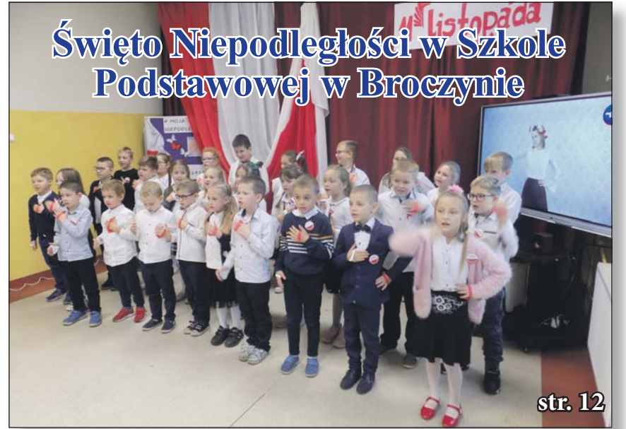
Święto Niepodległości w Szkole Podstawowej w Broczynie