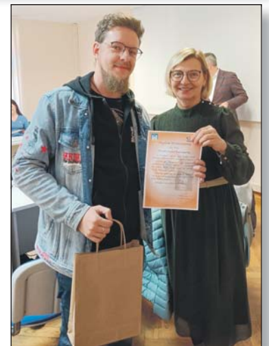
Lista zwycięzców, których zdjęcia ukażą się w kalendarzu na rok 2025:

W niedługim czasie kalendarze trafią do gminy, gdzie będzie można bezpłatnie odebrać swój egzemplarz. O terminie i możliwości odbioru bezpłatnych kalendarzy będziemy informować na bieżąco.