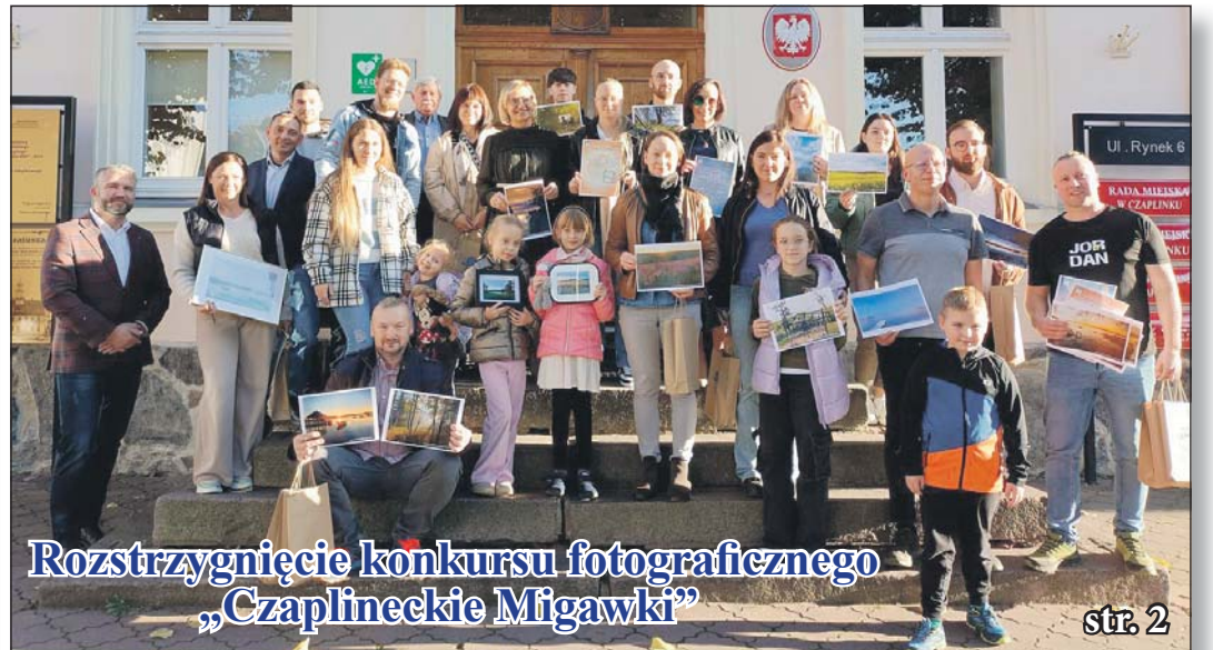
Rozstrzygnięcie konkursu fotograficznego „Czaplinackie Migawki”