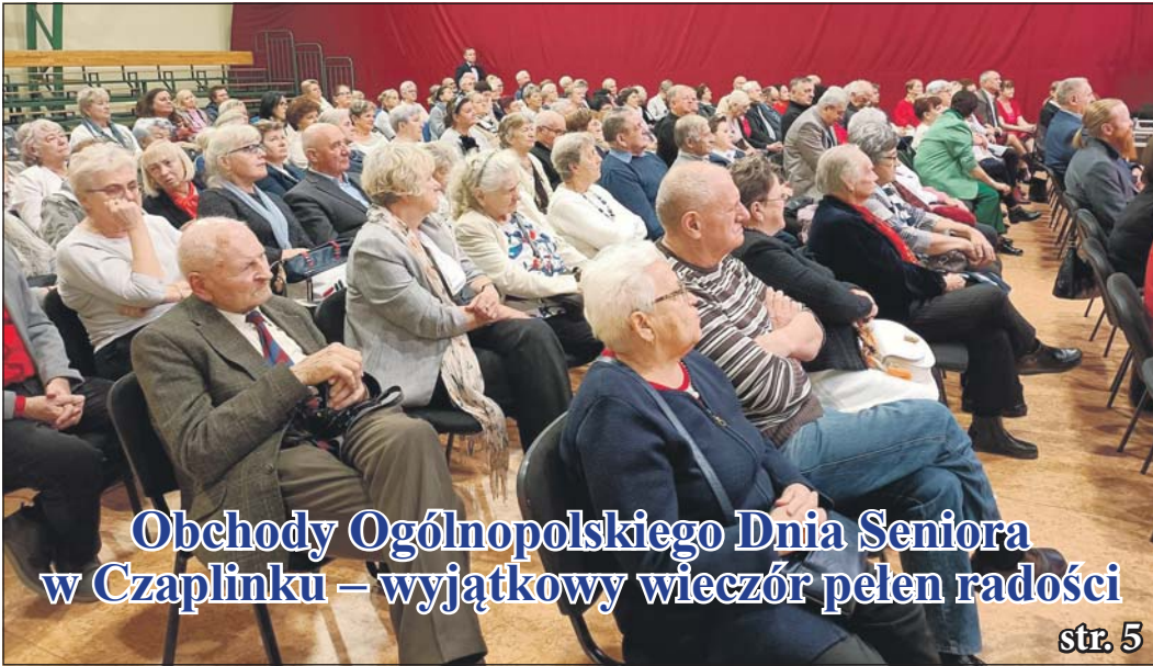
Obchody Ogólnopolskiego Dnia Seniora w Czaplunku – wyjątkowy wieczór pełen radości