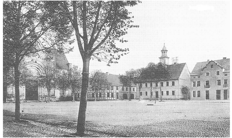
Czaplinecki rynek na początku XX w.

Nie ulega wątpliwości, że istnieje zapotrzebowanie na publikacje poświęcone lokalnej historii. Publikacji o dziejach naszego miasta jest sporo, ale są to przeważnie artykuły rozproszone w różnych periodykach. Wyjątkowym wydarzeniem było wydanie w latach 2009 – 2010 z inicjatywy Stowarzyszenia Przyjaciół Czaplinka trzypięciotomowego opracowania „Czaplinek 1945 – 2009”. Wydanie trzech tomów tej książki o łącznej objętości 1210 stron należy - obok ukazujących się od 2013 roku „Zeszytów Siemczyńsko-Henrykowskich” - do największych przedsięwzięć w zakresie wydawnictw książkowych poświęconych dziejom ziemi czaplineckiej.