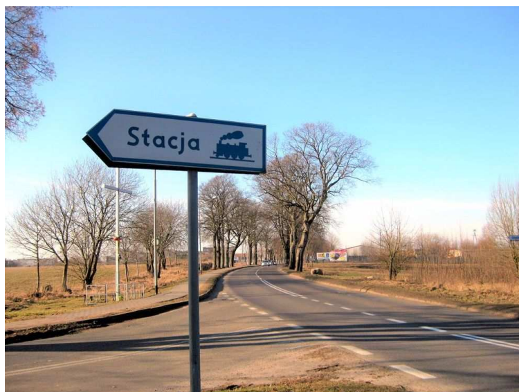
1. Początek ul. Dworcowej (fot. Zb. Januszaniec, 2013 r.).

Gdy przystąpiono do budowy nowej linii kolejowej z Czaplinka do Jastrowia, budowa ta wzbudziła wśród ówczesnych mieszkańców Czaplinka nadzieję, że wzniesiony zostanie drugi dworzec w bezpośrednim sąsiedztwie miasta. Tym razem władze miejskie czyniły starania o doprowadzenie torów bliżej miasta. Nie przyniosły jednak one efektu. Oddana do użytku w dniu 1 października 1908 roku jednotorowa linia kolejowa łącząca Czaplinek z Jastrowiem również biegła z dala od zabudowy miejskiej. Moim zdaniem, nie ma w tym nic dziwnego. Oczywiście względy topograficzne zdecydowały o tym, że w praktyce trudno byłoby sobie wyobrazić wytyczenie tej, biegnącej w kierunku południowym linii, w inny sposób, niż to zrobiono. Po kilku latach pojawiła się kolejna szansa na spełnienie oczekiwań mieszkańców Czaplinka, związana z planowaną budową następnej linii kolejowej Czaplinek – Barwice. W 1914 roku zapadły już nawet decyzje o budowie tej