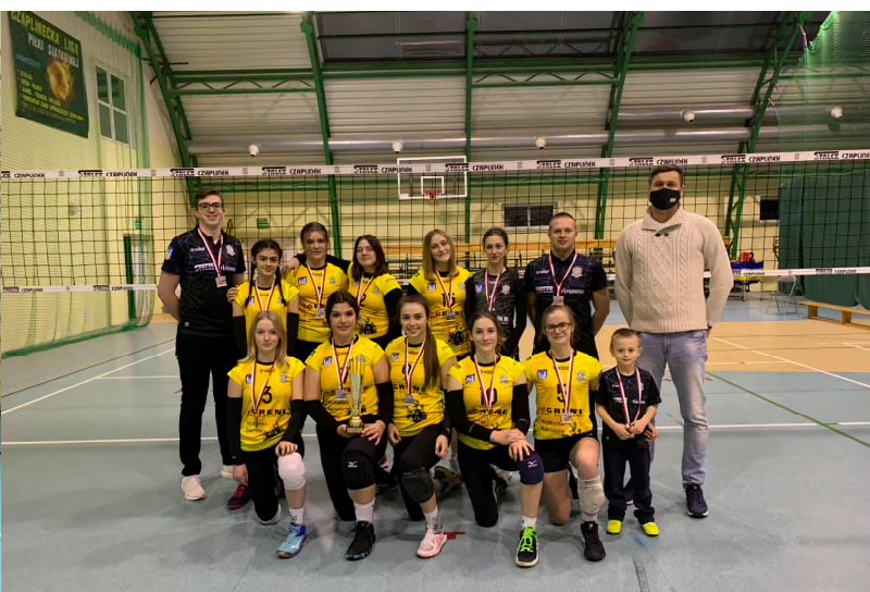
Kadetki po zdobyciu wicemistrzostwa województwa zachodniopomorskiego