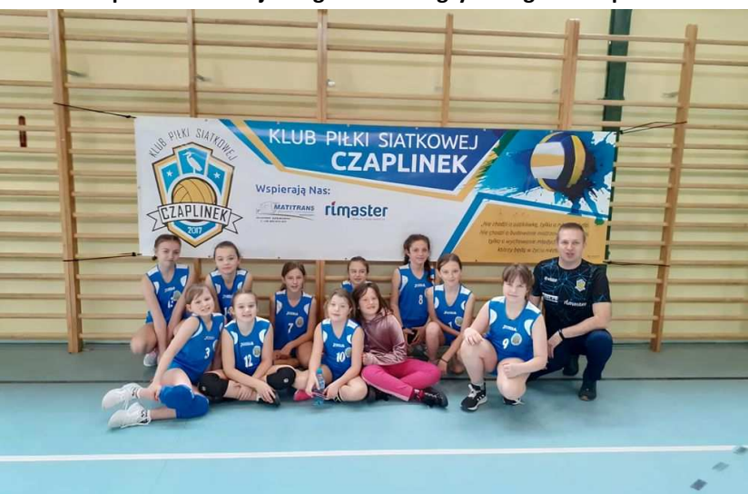
Najmłodsze siatkarki KPS Czaplunek podczas eliminacji wojewódzkich w ramach turnieju Kinder + SPORT 2021