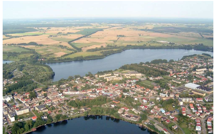
4. Zabudowa miasta całkowicie wypełnia wąski przesmyk między jeziorami Drawsko i Czaplino (zdjęcie lotnicze Czaplina z 2001 r.).

Moim zdaniem, nigdy nie wchodziło w grę także rozwiązanie polegające na wybudowaniu kolejowego mostu nad jeziorem. Na całej trasie od Runowa Pomorskiego do Chojnic takiego rozwiązania nie znajdziemy. Nie wchodziło ono w grę nie tylko ze względu na koszty. Trasa o strategicznym znaczeniu nie powinna mieć długich mostów. Przy budowie linii Runowo Pomorskie – Chojnice chętnie korzystano natomiast z rozwiązań, jakie można osiągnąć w wyniku prac ziemnych. Znaczne odcinki tej linii biegły w głębokich wykopach lub po wysokich nasypach. Przesmyki między jeziorami oraz podmokłe doliny Pomorska Kolej Centralna pokonywała z reguły po nasypie. Dodam jako ciekawostkę, że prawie wszędzie tam, gdzie powstał długi i wysoki nasyp – do dzisiejszego dnia możemy zaobserwować w terenie widoczne ślady wyrobisk, powstałych przy pozyskiwaniu ziemi do budowy nasypu. Ślady dawnych wyrobisk znajdujemy także w pobliżu kolejowych nasypów w okolicach Czaplina (np. ślady wyrobisk nad Jeziorem Pławskim Małym oraz wyrobisko przy południowo-wschodnim brzegu jez. Czaplino).