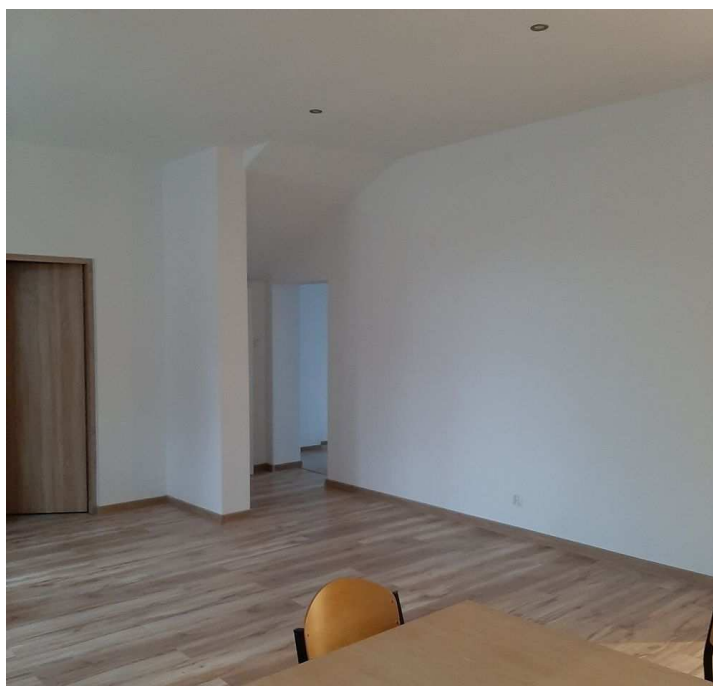
Pomieszczenia po remoncie