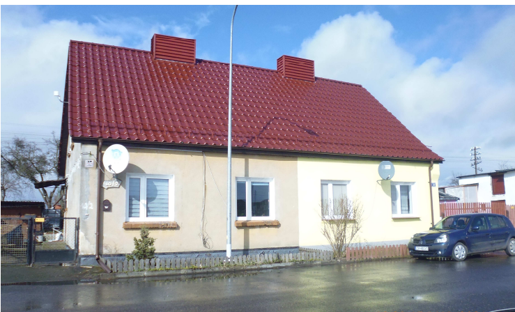
WM Dworcowa 10 - remont dachu