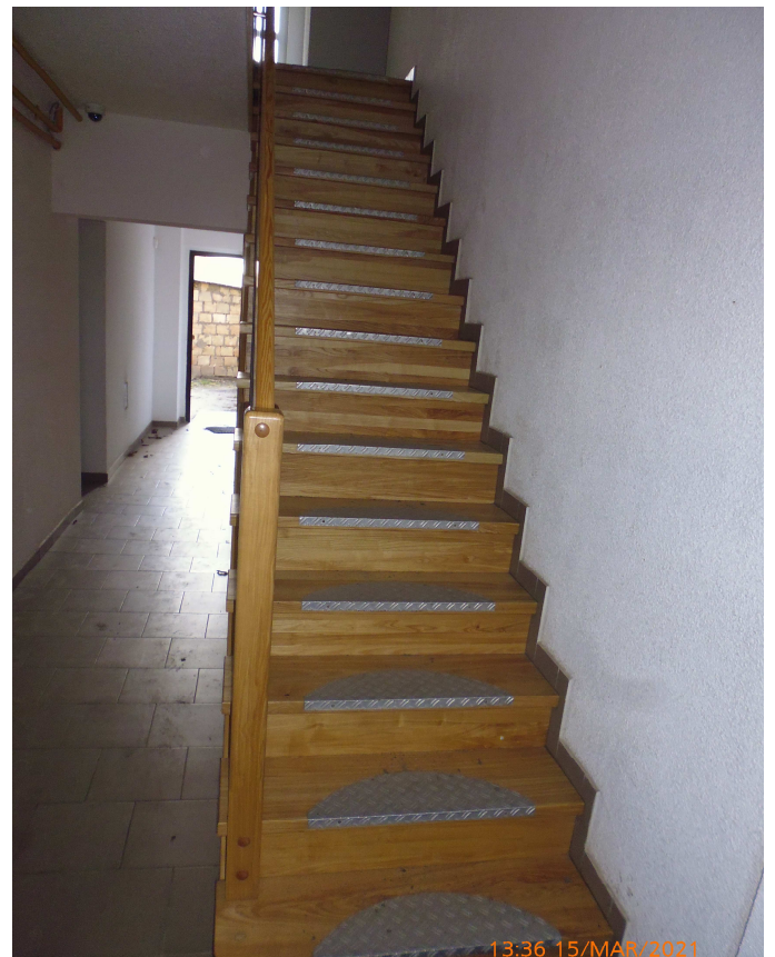
WM Szczecinecka 8 - remont klatki schodowej wraz z budową nowych schodów i monitoringiem