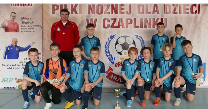
V miejsce KS Iras Czaplunek w roczniku 2011