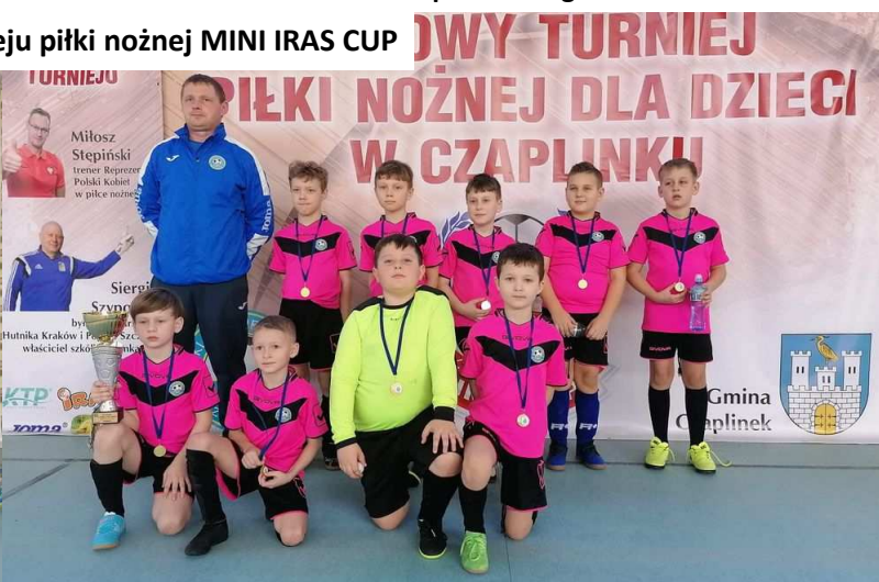
IV miejsce KS Iras Czaplunek w roczniku 2012