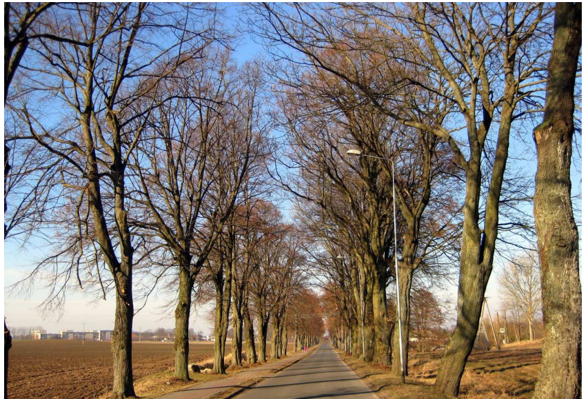
5. Krajobraz ulicy Dworcowej (fot. Zb. Januszaniec, 2013 r.)

używana przez rowerzystów i przez pieszych przemierzających trasę miasto - dworzec. Dodam jako ciekawostkę, że przez wiele powojennych lat numeracja budynków stojących przy tym odcinku dzisiejszej ul. Dworcowej przypisana była do ul. Wałęckiej. Sprawę nazewnictwa i numeracji posesji unormowano tu prawdopodobnie dopiero w latach siedemdziesiątych, na co może wskazywać treść uchwały Miejskiej Rady Narodowej z 2 czerwca 1970 roku w sprawie nadania nazw ulic. W uchwale tej wymieniona została m.in. ulica Dworcowa. Przy wspomnianej wcześniej zagrodzie rolniczej ulica Dworcowa skręca pod kątem prostym w kierunku dworca. Tu zaczyna się drugi, biegnący