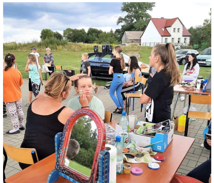
Wakacyjne animacje, organizowane wraz Czaplineckim Ośrodkiem Kultury

Jednym ze sposobów pozyskiwania środków przez sołectwo jest sprzedaż lokalnych wyrobów – zarówno kulinarnych, jak i rękodzielniczych. Kluczewo słynie ze swoich przetworów i jest za nie nagradzane. W minionym roku w organizowanym przez Powiat Drawski „Mobilnym Festiwalu Stoika” nagrodzono kluczewskie: borowiki w zalewie octowej, galaretkę i nalewkę z płatków róży.