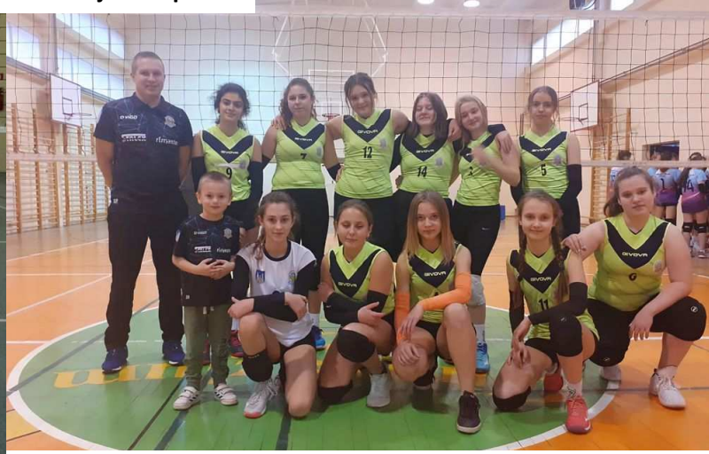
Młodziczki podczas turnieju ligowego w Wałczu