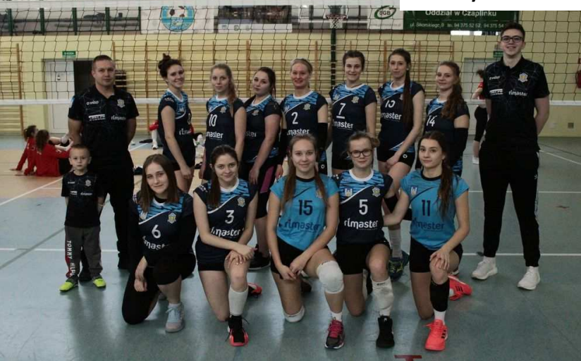
Seniorki podczas turnieju 3 ligi kobiet rozgrywanego w Czaplunku