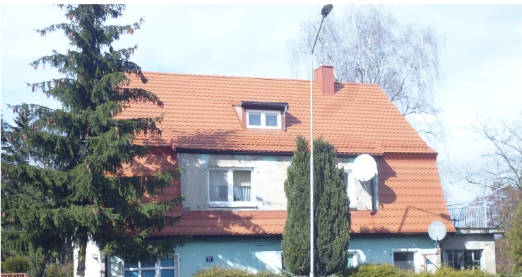
WM Kościuszki 21 - generalny remont dachu

W bieżącym roku trwają przygotowania dokumentacji do kilku nowych inwestycji remontowych wykonywanych przez wspólnoty mieszkaniowe.