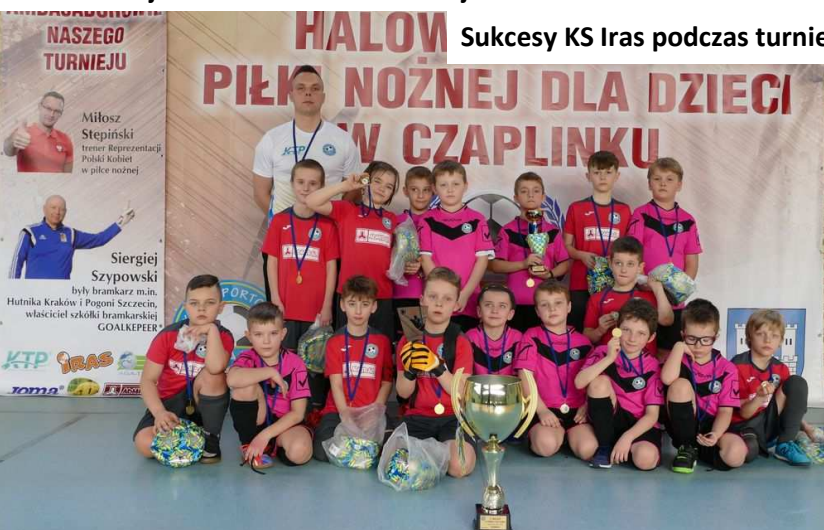
II miejsce KS Iras Czaplunek w roczniku 2013.