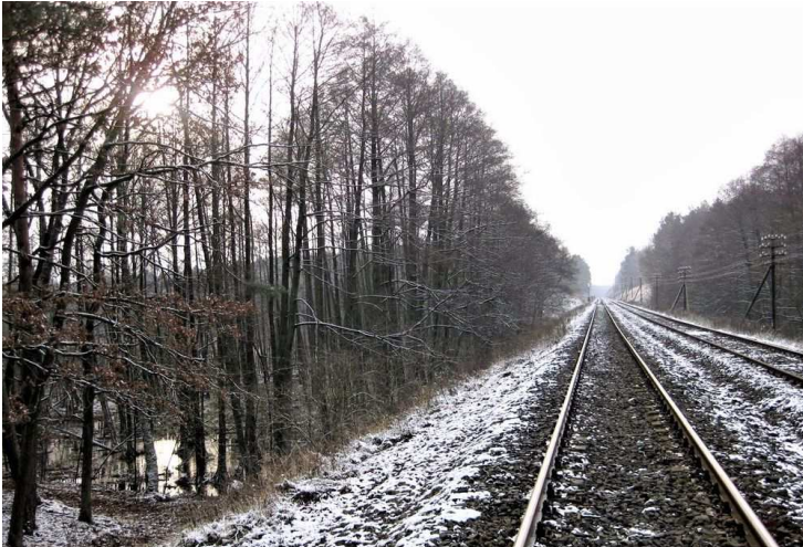
3. Tory w przesmyku między jeziorami Pławno i Pławskie Małe (fot. Zb. Januszaniec, 2012 r.).

Jednak przeprowadzenie linii kolejowej przez wąski przesmyk między tymi jeziorami całkowicie nie wchodziło w grę, gdyż wypełniony był on już wówczas przez zabudowę miejską w sposób wykluczający poprowadzenie tędy torów. Współczesny wygląd przesmyku prezentuje ilustracja nr 4.